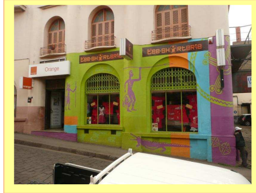
En face de la boutique « Orange »